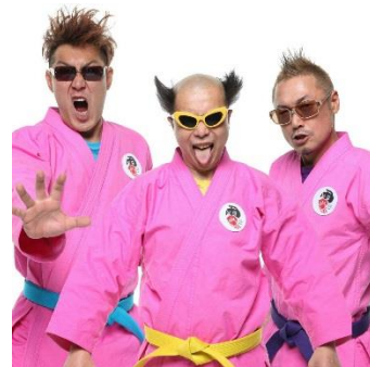
電撃ネットワーク (オープニングアクト)