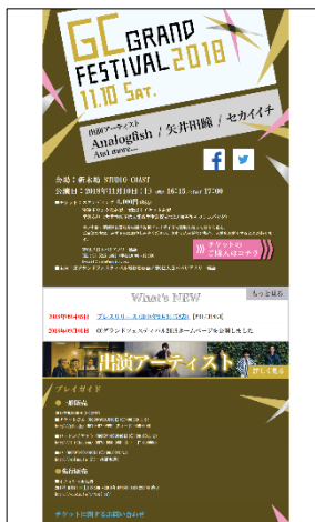
オフィシャルサイト制作