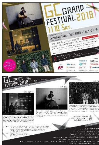
障がい者の仕事内容例 印刷物デザイン、印刷