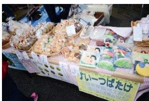
過去の GC グランドフェスティバルで開催したフュージョンマーケットの様子